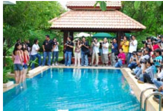
ThaiDphoto.com Portrait # 5