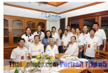
ThaiDphoto.com Portrait Trip #5