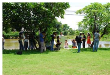
ถ่ายแบบริมคลองบางใหญ่

กำหนดการท่องเที่ยวล่องเรือย้อนอดีตชมวิถีไทย ตามรอยสุนทรภู่ล่องเรือคลองบางใหญ่และคลองมหาสวัสดิ์ (บางสถานที่ระบุไว้ในนิตราศพระประถม และนิตราศสุพรรณ) (กรุณาเตรียมหมวกหรือร่ม)